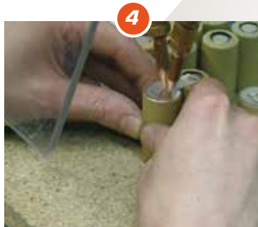
4 Nieuwe cellen lassen