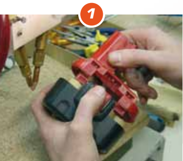
1 Openmaken accu

Laat uw accu-packs bij ons vernieuwen en bespaar tot 50% ALLE MERKEN !