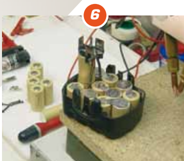
6 Dichtlijmen of schroeven